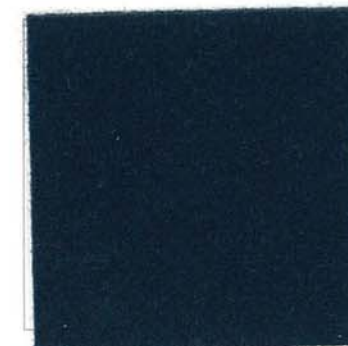
Q-8 インディゴブルー