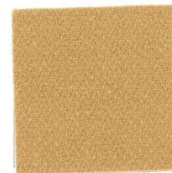
Q-3 ゴールデンイエロー