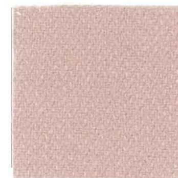
Q-4 フレッシュピンク