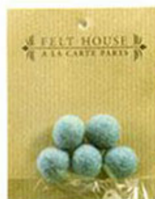
ウールボンボン 20 ミリ 5個入り 色番：25