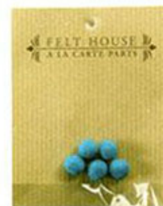
ウールボンボン 10 ミリ 5個入り 色番：21