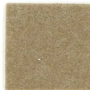
M-21 ヘンプ hemp