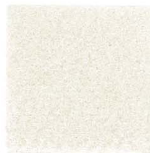
M-20 バニラ vanilla