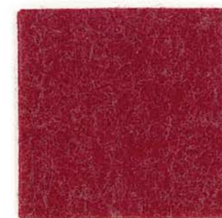
M-11 チェリーレッド cherry red