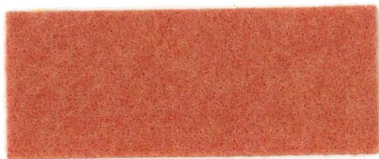
M-31 アプリコット apricot