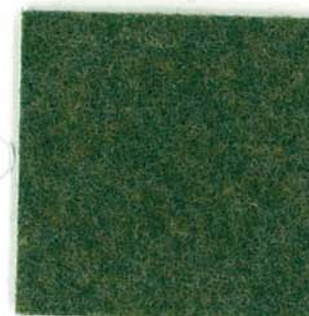
M-40 リーフグリーン leaf green