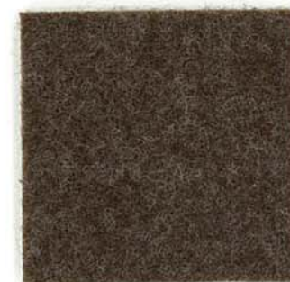
M-22 カカオ cacao