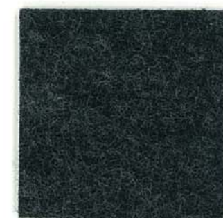
M-79 チャコール charcoal