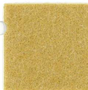
M-30 サフラン saffron